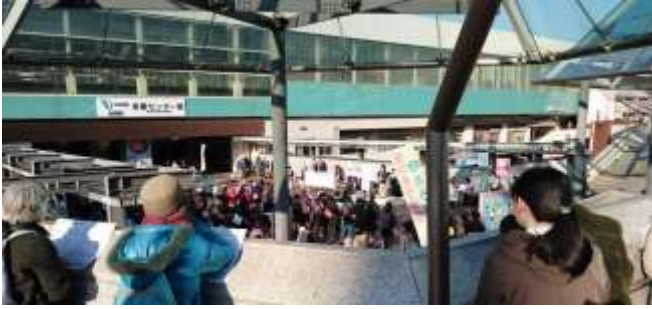
400人が参加した「ジャックザ多摩センター」

*今年の高齢者大会は東京です。ぜひ、盛り上げるため、たくさんの方の参加をお願いします。